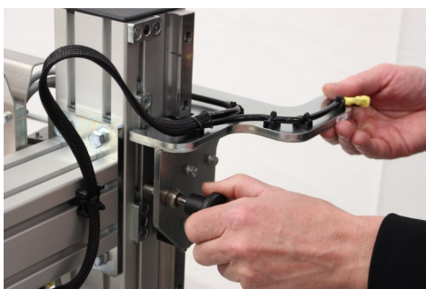
• Hurtig indstilling af båndhøjde