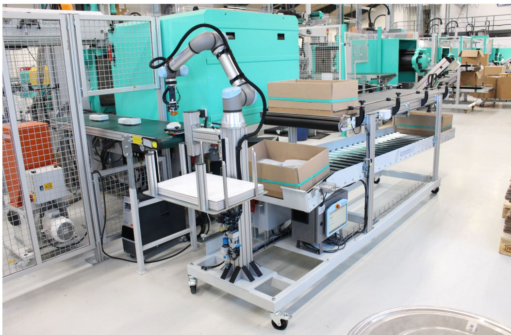
1. Flyt til Transportbånd 2. Placer fikseringsland 3. Vælg program 4. Tryk START