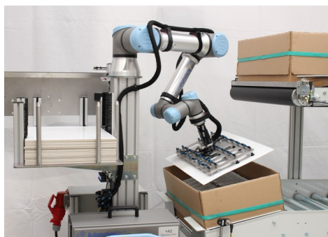
• Placering af pap mellem hvert lag